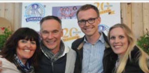
Familie Gamsjäger lachte in die Kamera.